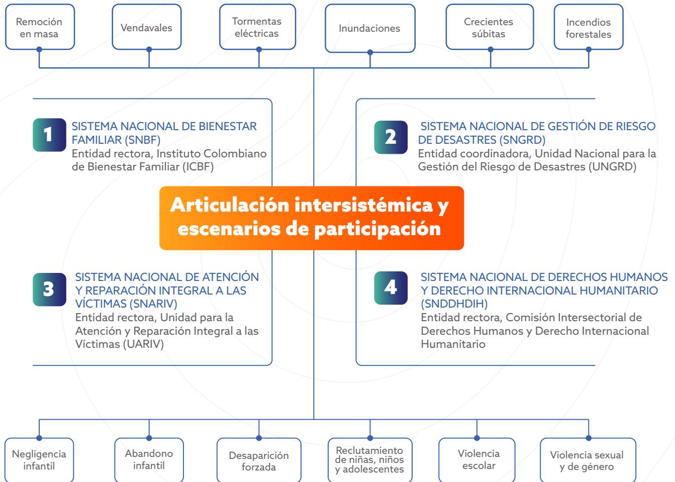
Figura 1. Articulación Intersistémica y escenarios de participación.