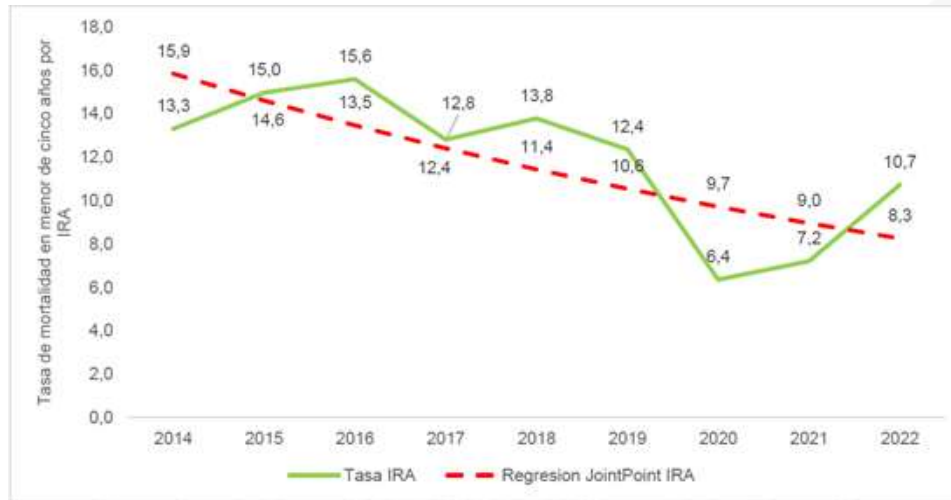
Grafica 1. Tendencia de tasas de mortalidad en menor de cinco años por IRA, Colombia, 2014-2022.

Fuente: Informe de evento Vigilancia integrada de las muertes en menores de 5 años por Infección Respiratoria Aguda (IRA), Enfermedad Diarreica Aguda (EDA) o Desnutrición Aguda (DNT). © 09 junio 2023. Instituto Nacional de Salud. Bogotá, Colombia.